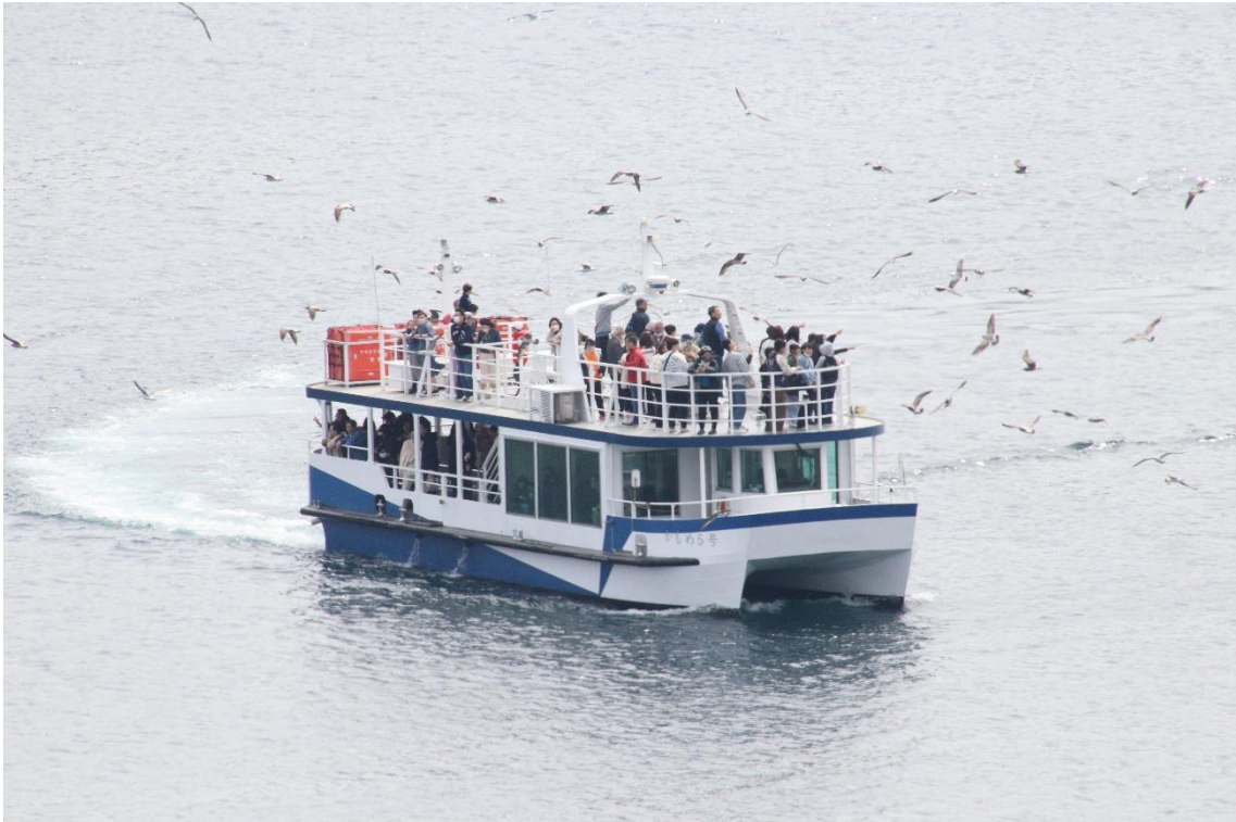
伊根湾遊覧船「かもめ5号」。船名にふさわしく鷗が群れていました。