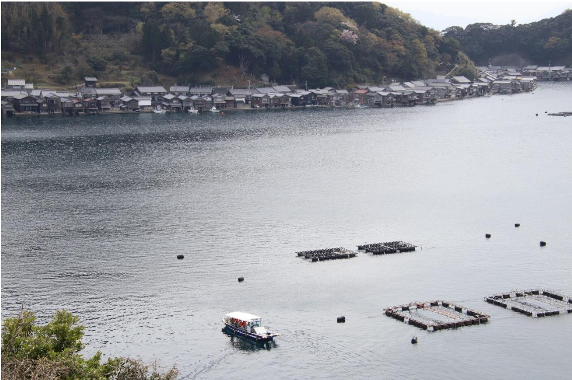
道の駅から望む伊根湾の町並み。

伊根湾の観光船は、以前は丹後海陸交通の運航する遊覧船だけだったように思うのですが、海上タクシー会社の運航する小型遊覧船がたくさん就航するようになっていて、乗客で賑わっていました。