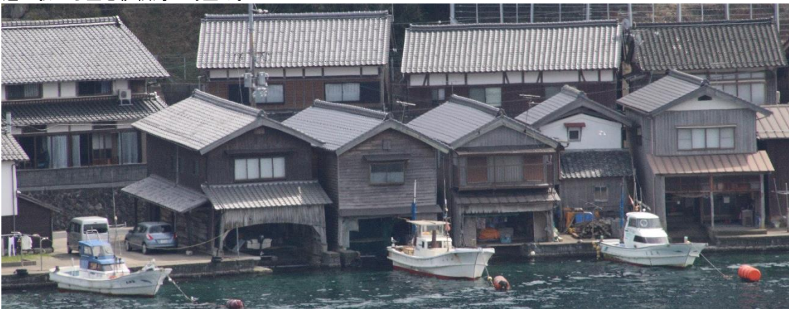
舟屋。船が大きくなって、家の下には収納できなくなって、倉庫代わりにになっている家も多いようです。